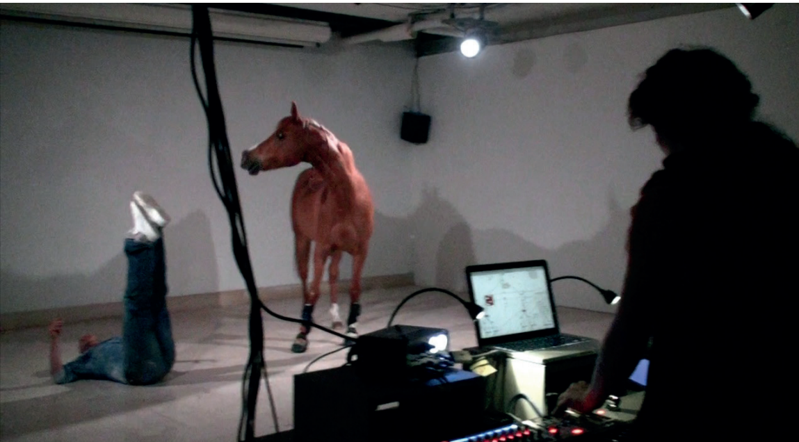
Fraction 01 , février 2014 ESAP - Pavillon Bosio, Monaco