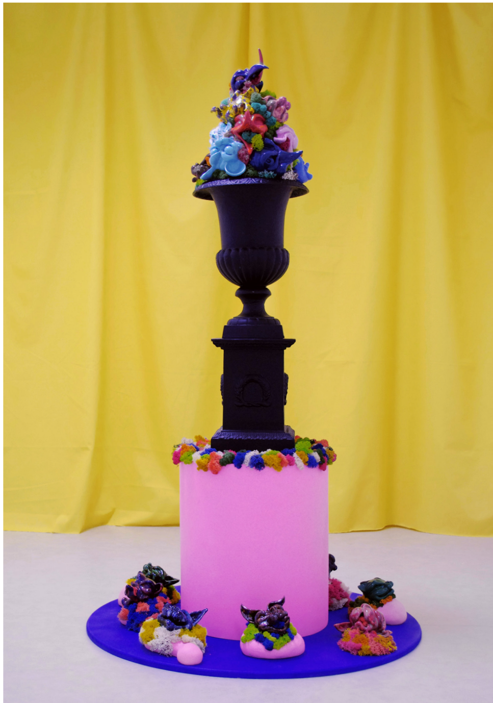
Cornucopia, (ou la poubelle des désirs), matériaux mixtes, H: 160 cm D: 90 cm, 2018.