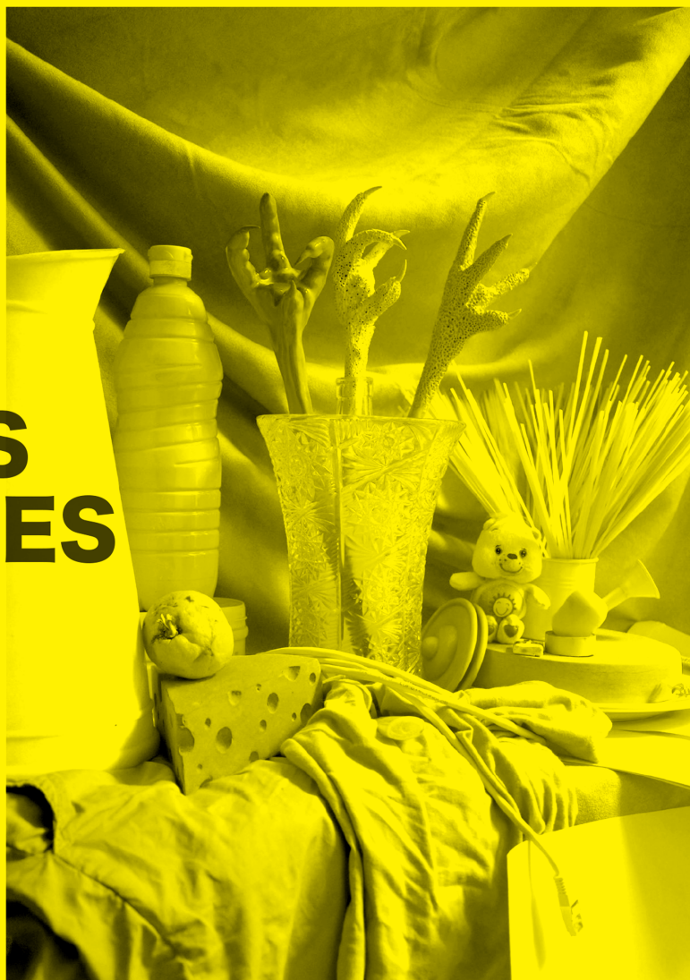
Natures mortes monochrome - Yellow - 2018

AVEC UNE CRÉATION SONORE DE NICOLAS DELLIAC