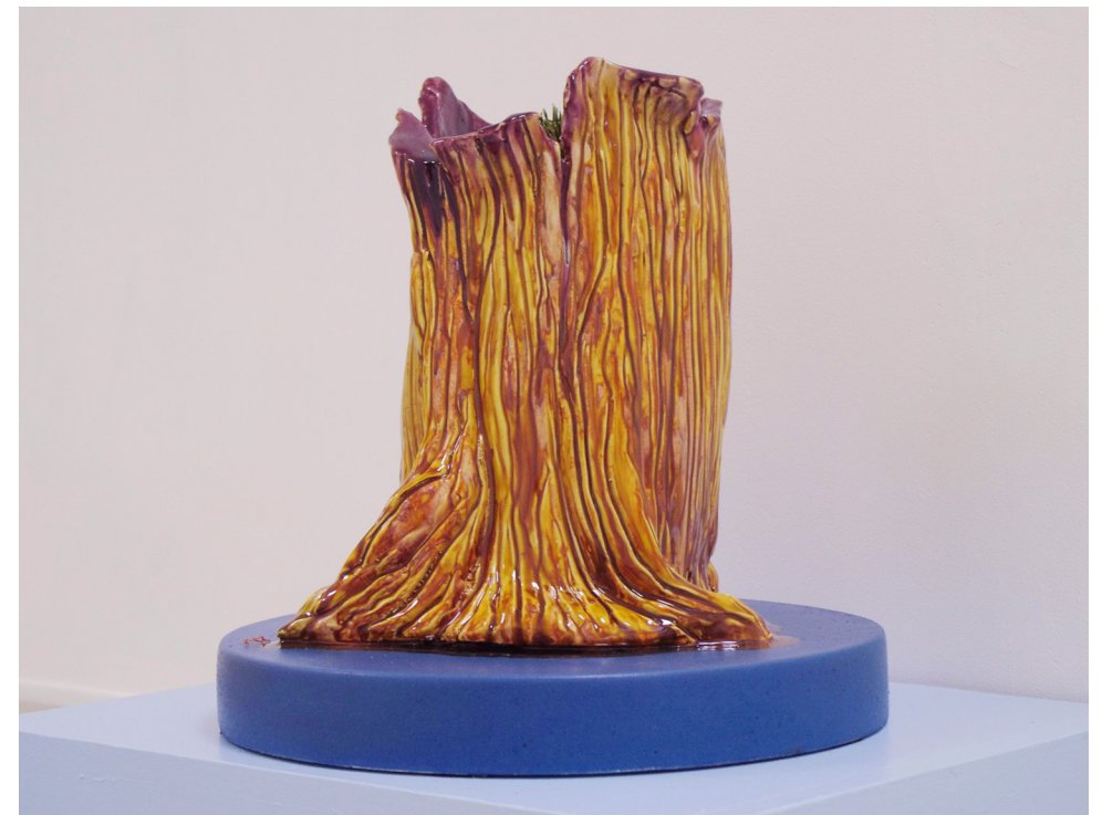
Bouche-Tronc, (une souche avec un vide émotionnel à remplir) , céramique émaillée polychrome, D: 36 x H: 35 cm, 2018.