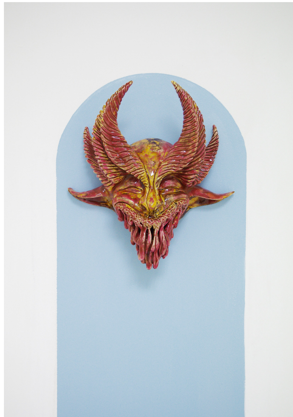
Sleeping Demons - untitled yet , céramique murale émaillée polychrome, 32 x 34 x 19 cm, 2019.