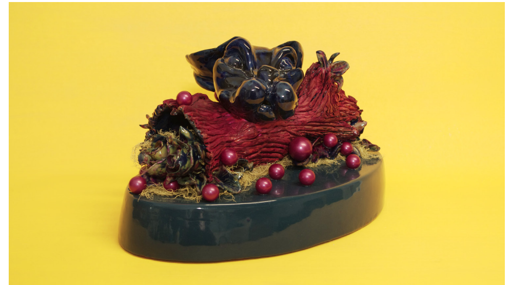
Nature Morte; phénomène changeant , céramique émaillée polychrome, mousse végétale, verre, 36 x 22 x 20 cm, collection Roux, 2018.