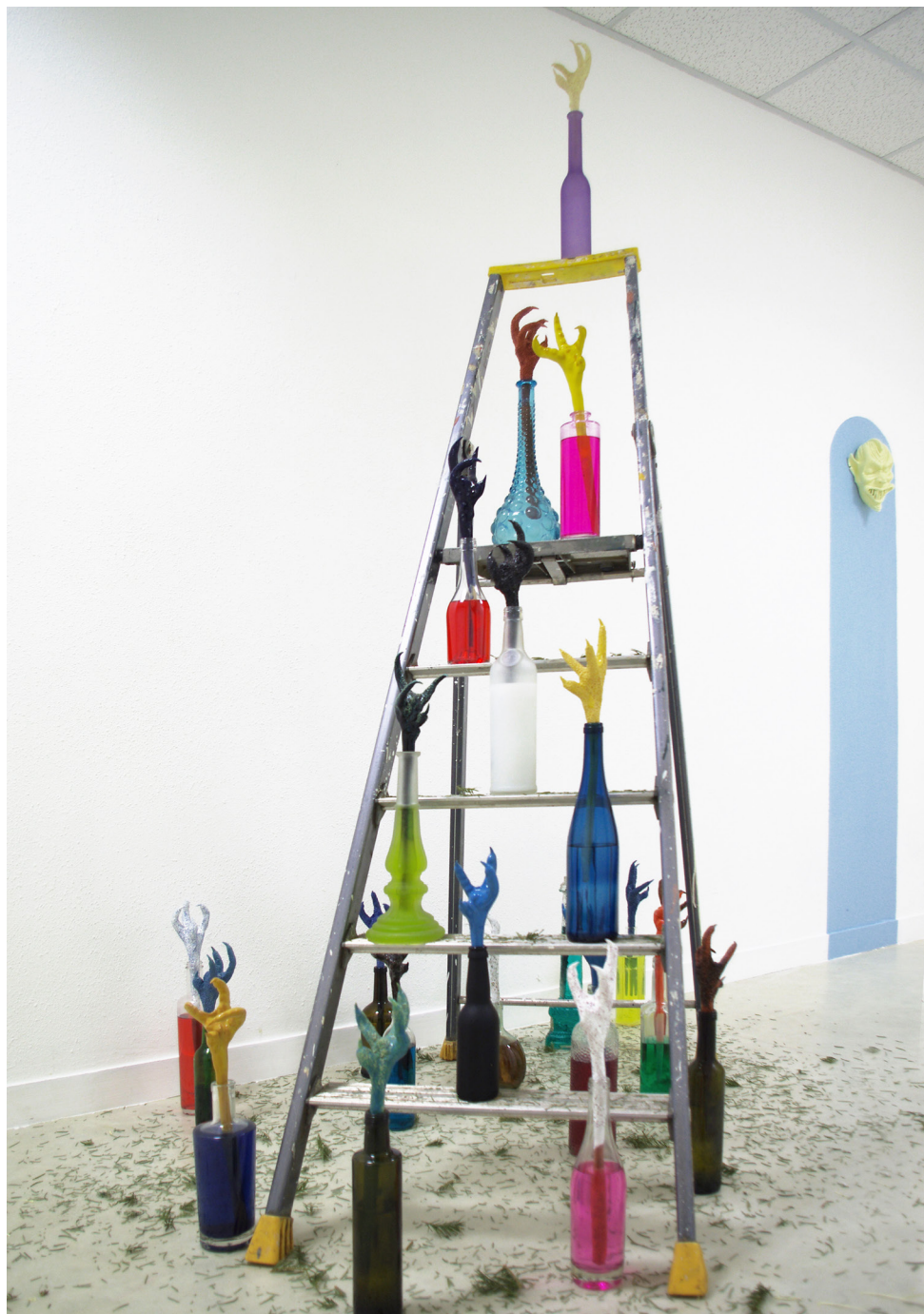
Cathédrale précaire , installation de vingt-et-une Fleurs du mal , céramiques émaillées monochromes figées dans des bouteilles de verres aux liquides colorés, 2018.